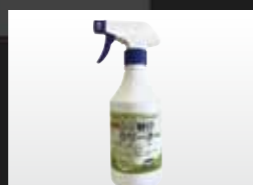
シミ取りクリーナー

グラフトポリマー吸着剤と銀イ オンで、しつこい臭いを強力に吸 着・消臭・除菌・防臭する消臭ス プレーです。