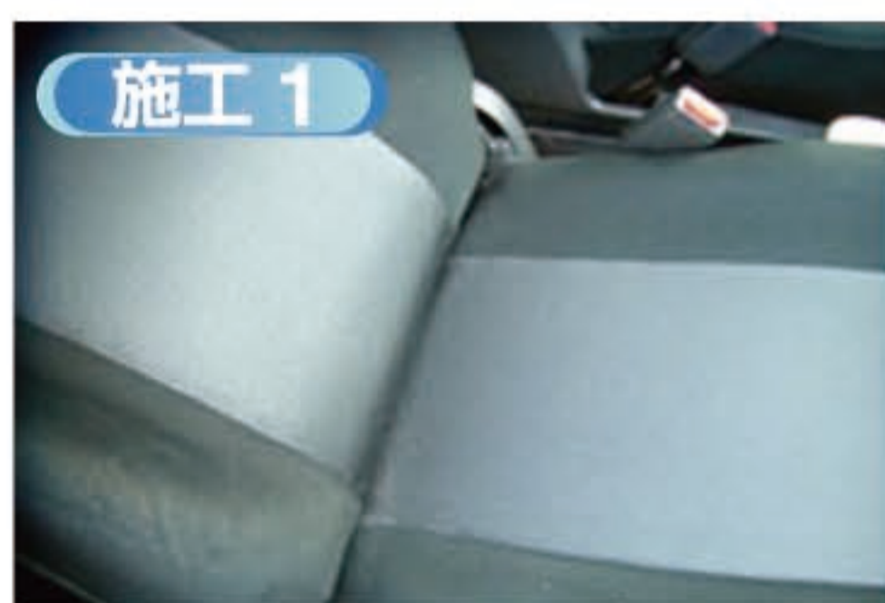
■ 専用工具を使い、こびりついているダニの「糞」など、ダニアレルゲンをシートの奥から離し、吸い上げます。