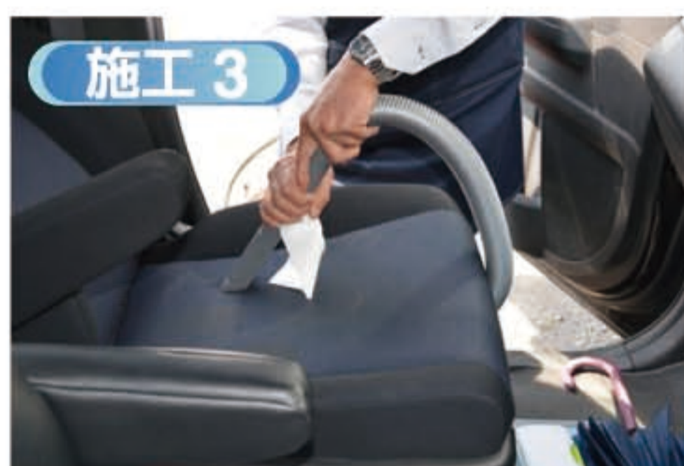
■ 乾燥後、強力バキュームクリーナーでアレルリムーバーに閉じ込めた微細なダニアレルゲンを吸い上げます。