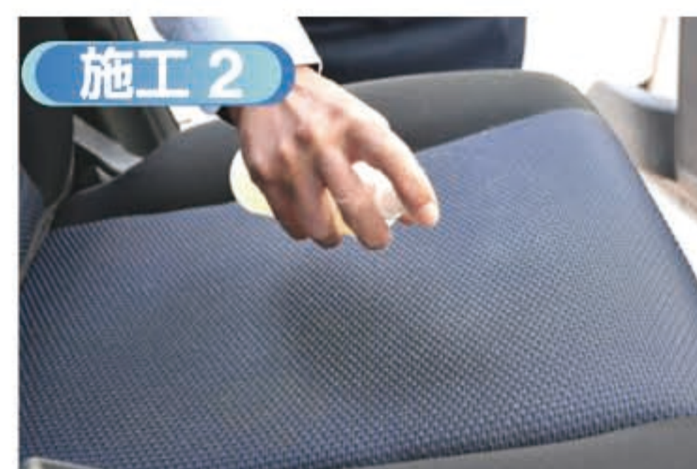
■ アレルリムーバー A をスプレーしダニの糞などを擬集し吸着効果を最大限に高めます。